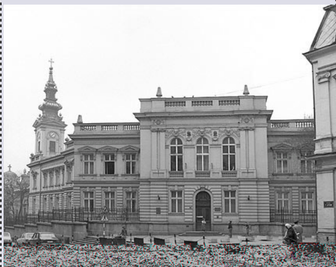
Privatna fotografija, obitelj Lazarević